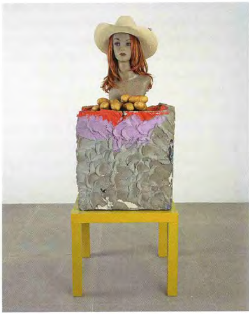
RACHEL HARRISON, THIS IS NOT AN ARTWORK , 2000–2006, mixed media, 59 x 22 x 22" / DAS IST KEIN KUNSTWERK , verschiedene Materialien, 150 x 56 x 56 cm.